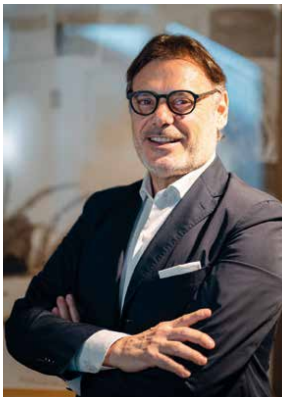
Marco Sarto Sindaco di Caorle (Venezia)